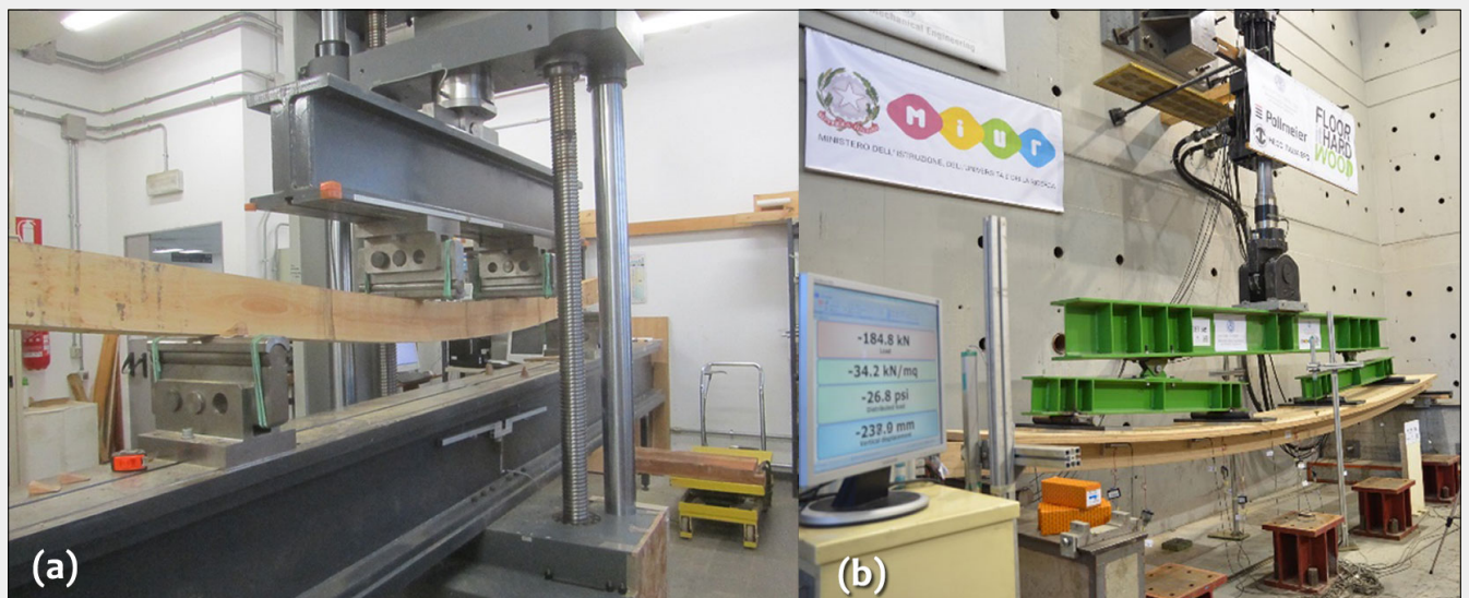
Fig. 1 - Prove meccaniche su (a) tavole e (b) prodotti strutturali in legno di faggio.