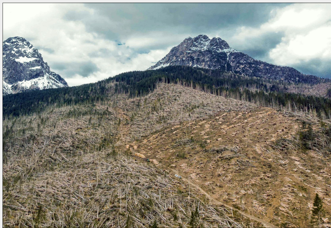
Fig. 1 - Sappada (UD). La tempesta Vaia ha provocato alla fine di ottobre 2018 l'abbattimento di oltre 42.000 ha di foresta e di oltre 10 milioni di metri cubi di legname. Le statistiche del post-evento sono in fase di continuo aggiornamento, ma nel corso del 2019-2020 sono stati raccolti nelle regioni e nelle province autonome del nord-est oltre 6 milioni di metri cubi di legname che non risultano in modo adeguato e coerente nelle statistiche forestali disponibili.

proveniente da foresta ma da scarti e legname riciclato (imballaggi in legno, ad esempio), anche se c'è una evidenza empirica che gran parte di queste biomasse siano utilizzate per impieghi industriali.